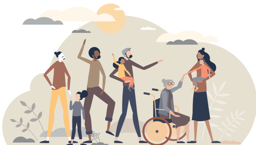
Dossier CCAS : être aidant aux pages 20 et 21