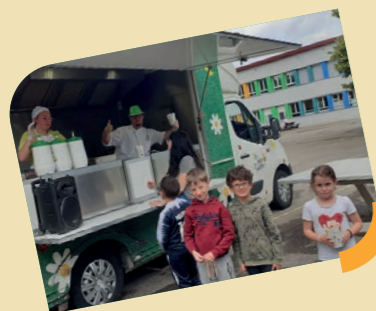
Food truck : en fin d'année scolaire, nos écoliers ont pu goûter aux joies du Food Truck !