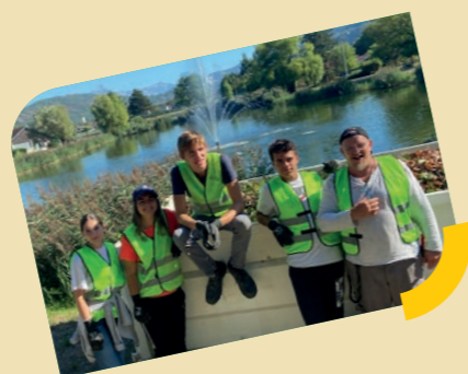
Chantiers jeunes : cet été quatre groupes de jeunes ont travaillé activement pour embellir notre commune (cantine, école du Pavillon, salle Navarre, espaces verts ...).