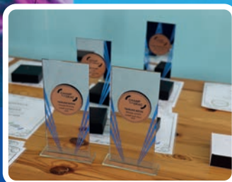
Sportifs méritants 2022 Page 16