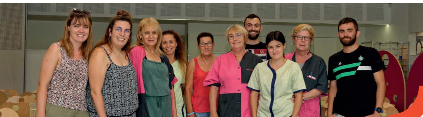
L'équipe périscolaire du midi

Enfin, l'implication et l'investissement de l'ensemble des services de notre collectivité et animateurs ont permis d'assurer un travail de qualité et une continuité tout au long de l'année malgré le contexte difficile.